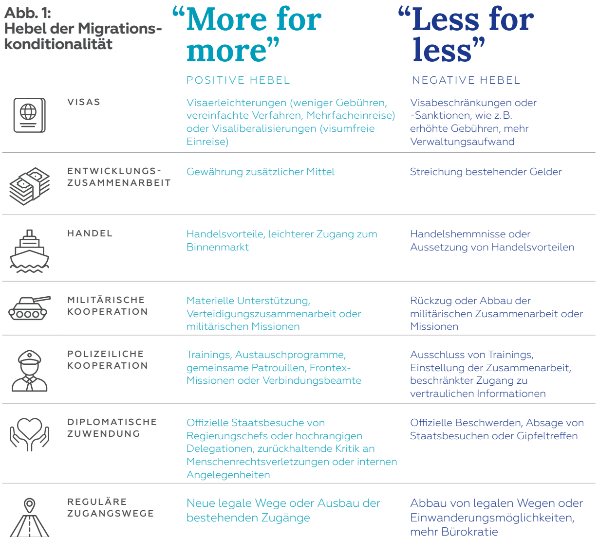
Abb. 1: Hebel der Migrations- konditionalität