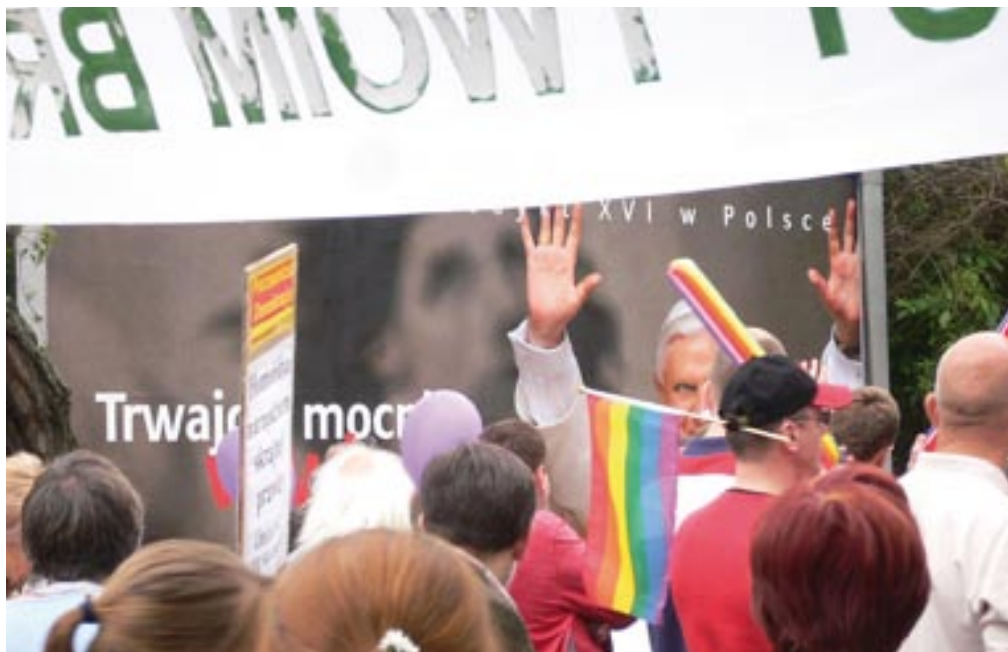
Die Demonstration »Parada równości« (»Parade der Gleichberechtigung«) in Warschau

Kirche seit dem Ende der Franco-Diktatur deutlich weniger gesellschaftlich verankert als in Italien und in Polen. Entscheidend ist aber, dass es (3) sowohl in Italien wie auch in Polen politische Entscheidungsträger gibt, die, sei es aus Populismus oder persönlichem Glauben, der moralpolitischen Linie des Vatikans folgen und gegen Liberalisierungsmaßnahmen entscheiden. In Spanien gibt es auch solche Positionen. Sie sind jedoch (4) – anders als in Polen und Italien – nur in dem politisch homogenen rechten Lager zu finden.