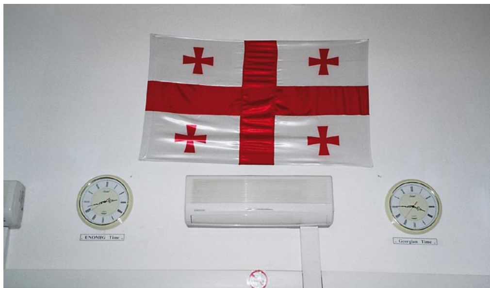
UNOMIG- und Georgien-Zeit

orgischen Seite der Waffenstillstandslinie prangte an der Wand im Aufenthaltsraum die neue georgische Nationalflagge flankiert von zwei Uhren – UNOMIG Time und Georgian Time. Die Vereinten Nationen leisteten sich also für ihre Mission in Georgien eine eigene Zeit, die der Georgischen eine Stunde hinterher läuft. Warum? Erhellung brachte die Fahrt nach Suchumi in das abtrünnige Abchasien. Dort tickten alle Uhren nach Moskauer Zeit, also im Winterhalbjahr mit einer Stunde Unterschied zur Tifliser Zeit. Warum hat aber auch die Mission der Vereinten Nationen, die Georgien im Namen führt und für dessen territoriale Integrität eintritt, »Separatistenzeit« bzw. Moskauer Zeit? Ganz einfach: Das operative Hauptquartier der UN-Mission liegt nun einmal im abchasisch-kontrollierten Suchumi. Praktische und diplomatische Lösung: UNOMIG Time!