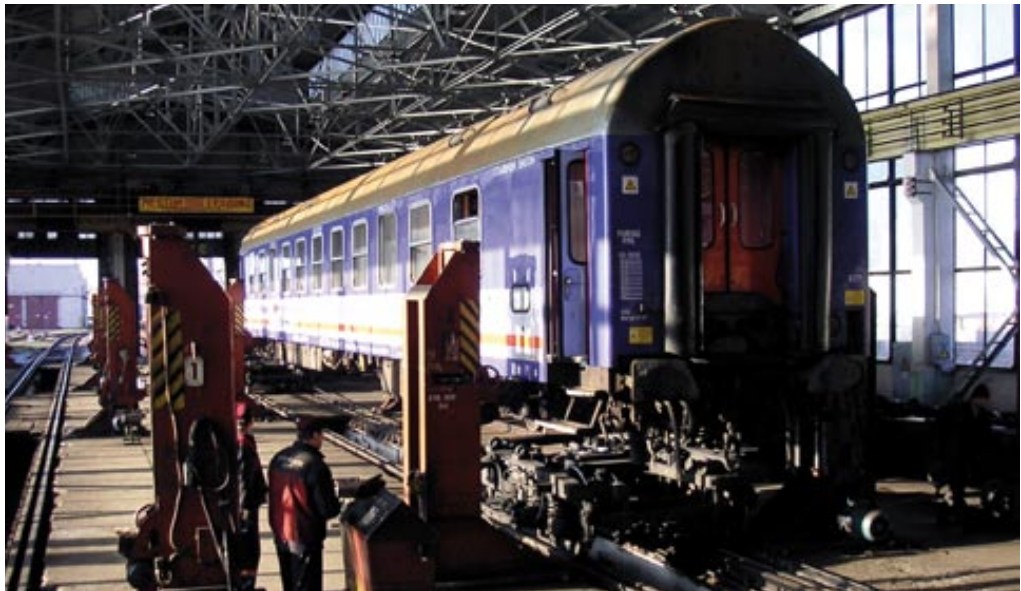
Spurwechsel in Brest an der polnisch-weißrussischen Grenze

Wir sitzen zu fünft auf einer langen sowjetischen Bettcouch, uns gegenüber einige Mitarbeiter einer Minsker Organisation für Rechtshilfe. Zuvor hatten wir uns im Stadtzentrum in einen der überfüllten Busse gequetscht, waren wenige Stationen später ausgestiegen und hatten in einem Innenhof zwischen fünfstöckigen Plattenbauten aus der Chruschtschow-Zeit den richtigen Eingang gesucht. Der Hof sieht wie alle Höfe aus, unter einer dünnen Schneedecke, die von den durchfahrenden Autos zerfurcht und dreckbespritzt ist, ragt der Müll heraus, der hier, anders als in der Stadtmitte, nicht täglich zusammengekehrt wird, da stehen Containergaragen, einige blattlose schlanke kränkelnde Bäumchen mit dünnen Kronen, rostende Kleinwagen sowjetischer Bauart, Reste von Geräten eines Kinderspielplatzes. Die Häuser sind im Gegensatz zu den stalinistischen Prachtfassaden im Zentrum unverputzt, es bröckelt der Beton, die notdürftig verglasten Balkone sind vollgestopft und eingegittert, ihre Funktion als Plätzchen an der Sonne scheinen sie längst verloren zu haben. Hinter dicken Gardinen sieht man Zimmerpflanzen, Katzenaugen und noch dickere Vorhänge hervorluken.