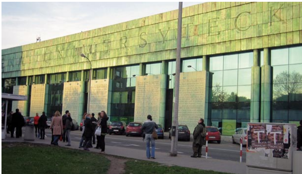
Die Universitätsbibliothek in Warschau

Ferner wird aufgezeigt, dass bis zum Ende der 1990er Jahre die wirklichen »Strippenzieher« der polnischen Politik meist außerhalb des Kabinetts blieben. In das schwierige Amt des Chefs von chronisch instabilen Koalitionsregierungen wurden stattdessen politisch relativ unbedeutende »Marionetten« entsandt, die von ihren Parteivorsitzenden gelenkt wurden. Folglich erlangten Personen, die bestenfalls durch parteipolitische Willensbildungsprozesse legitimiert worden waren, einen erheblichen Einfluss auf die Arbeit der parlamentarischen Exekutive. Auch mit dieser aus demokratietheoretischer Sicht bedenklichen Entwicklung kann womöglich die zurückhaltende Wahlbeteiligung bei den Parlamentswahlen der 1990er Jahre sowie der – zumal für neue Demokratien – bedenkliche Vertrauensverlust in die Institution Regierung erklärt werden.