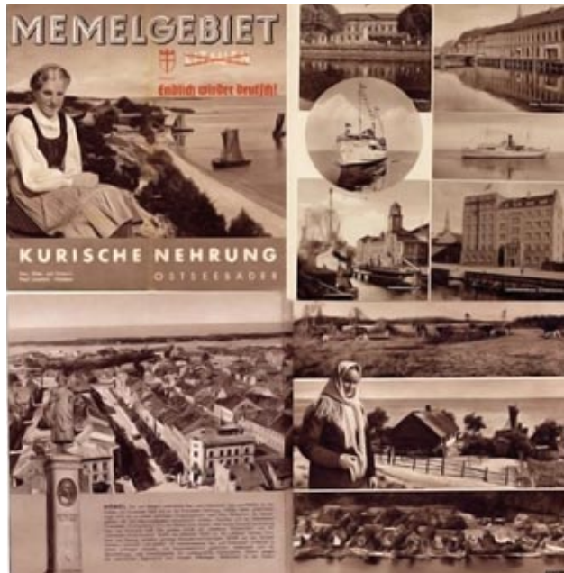
Prospekt »Memelgebiet« mit Fotografien von Paul Isenfels, nach 1939

Jenseits von nationalstaatlicher Identität scheinen Regionen authentischere Angebote der Selbstvergewisserung bereit zu halten, um den Einzelnen für die Herausforderungen einer globalisierten Welt kulturell zu wappnen. So betonen auch Normen politischer Richtlinien und Abkommen, wie die Landschaftsschutzkonvention des Europarates die essenzielle Bedeutung der Identifizierung von Menschen mit dem Gebiet, in dem sie leben, für eine nachhaltige Entwicklung einer Region und Europas insgesamt. Dem ehemals zu Ostpreußen gehörenden Preußisch-Litauen, heute zwischen dem Kaliningrader Gebiet und Litauen geteilt, bieten sich in dieser Hinsicht viel versprechende Perspektiven: Das multiethnische Kulturerbe stellt eine bedeutende Ressource für die Wachstumsbranche Tourismus dar. Die sich eröffnenden Möglichkeiten werden jedoch nur zu einem geringen Grad ausgeschöpft. Neben strukturellen Problemen der transregionalen Zusammenarbeit – über die EU-Außengrenze hinweg – liegt es nahe, einen weiteren Grund für die nur zögerliche Inwertsetzung der Vergangenheit darin zu vermuten, dass nur ein Teil des Kulturerbes die Schwelle zu den Kaliningrader und litauischen Selbstbildern in der Region passiert. Das als »deutsch« empfundene Erbe bleibt größtenteils fremd und entzieht sich somit nicht nur einer Vermarktung, sondern auch der entsprechenden Pflege.