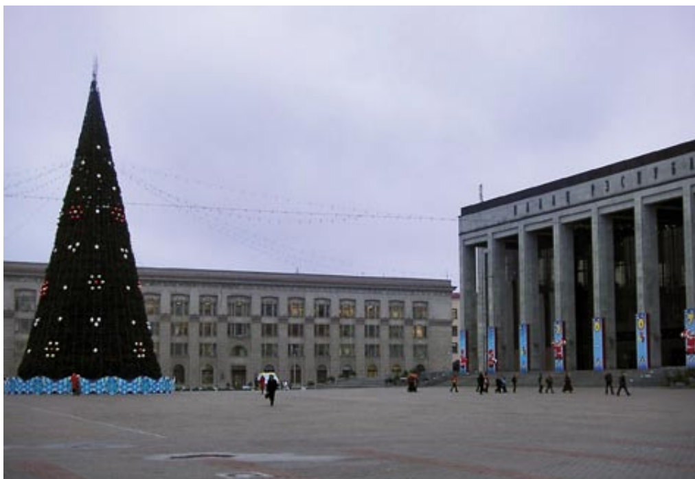
Weihnachtsdekoration vor dem Palast der Republik in Minsk

geht aus, statt des Präsidenten sehen wir Schwanensee. Begeistert stimmen wir letztlich in den Applaus des ausverkauften Hauses ein, es lebe Weißrussland!