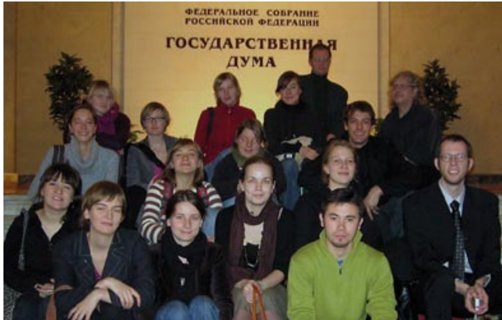
Mit den Projektteilnehmern in der russischen Staatsduma

Wielgohs geleiteten MA-Seminars an der Viadrina und semesterbegleitende Unterrichtsveranstaltungen im Rahmen des Lektorats am FRDIP.