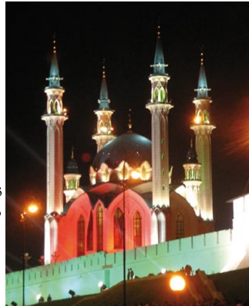
Der Kreml von Kasan

Anhand einer quantitativen und qualitativen Untersuchung der Kontakte der Republik Tatarstan zu anderen russischen Regionen wurde überprüft, welche offiziellen Formen der regionalen Kooperation und Koordination sich im postsowjetischen Russland entwickelt haben. Längere Vor-Ort-Aufenthalte in Moskau und Kasan wurden ergänzt durch Forschungsreisen in andere Regionen, in denen Tatarstan Ständige Vertretungen oder Handels- und Wirtschaftsvertretungen eingerichtet hat. Dabei konnte festgestellt werden,