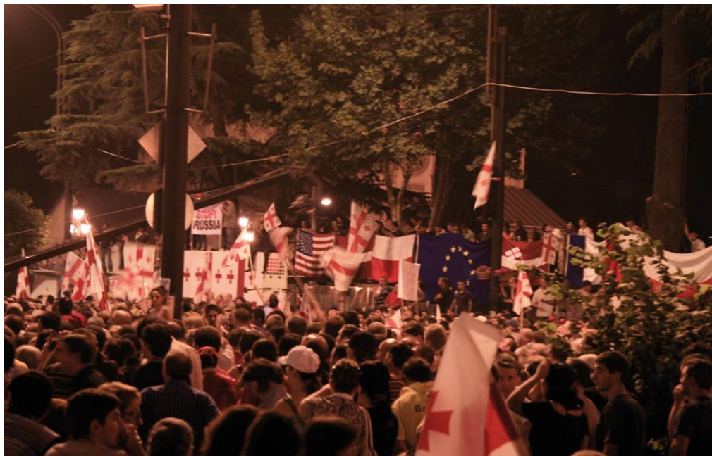
Die europäischen Sterne inmitten georgischer Kreuze

Als ich Georgiern von meinem Promotionsvorhaben erzählte, wurde ich oft mit der Frage konfrontiert, ob es nicht schwierig und gefährlich wäre, Korruptionsverbrechen zu erforschen. Mein Vorhaben zielt aber nicht auf eine Untersuchung des Ausmaßes der Korruption in Georgien und eine Antwort auf die Frage, ob Korruption seit der Rosenrevolution durch die Maßnahmen der georgischen Regierung reduziert worden ist. Die Arbeit analysiert vielmehr den Umgang verschiedener Akteure (georgische Regierung, Geberorganisationen, zivilgesellschaftliche Akteure) mit dem Konzept der Korruptionsbekämpfung. Ich gehe davon aus, dass Korruptionsbekämpfung von verschiedenen Akteuren unterschiedlich interpretiert wird. Ich versuche diese unterschiedlichen Ansätze anhand der Untersuchung konkreter Korruptionsbekämpfungsprojekten zu beleuchten. Mein Forschungsinteresse ist die Analyse der Art und Weise, wie lokale Akteure sich mit dem Import globaler Normen wie Anti-Korruptionsstandards auseinandersetzen.