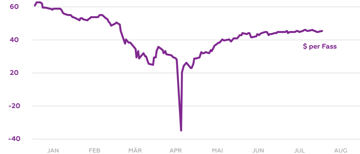
Abbildung 2: WTI Spot-Marktpreise in Dollar/Fass 2. Januar – 3. August 2020